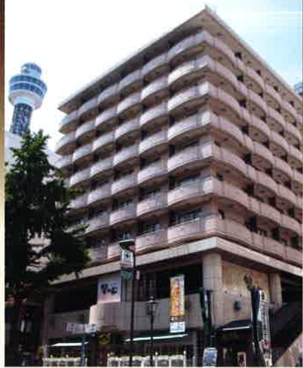
ベイシティ横浜の拠点、スターホテル横浜

美しい緑につつまれた山下公園とハーバーライトを臨む抜群のロケーション。 スターホテル横浜を拠点に、ヨコハマの旅が広がります。